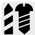
Taladro y destornillador