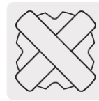
Punta de cruz