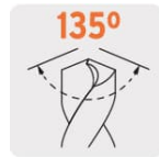
Ángulo de punta