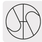
Punta Split Point