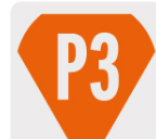
Zanco P3 antiderrapante