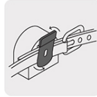
Clip de palanca para mejor sujeción