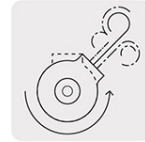
Válvula móvil para direccionar la salida de aire