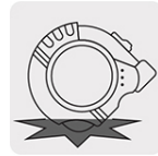
Resistente a impactos