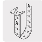
Cinta impresa por ambos lados