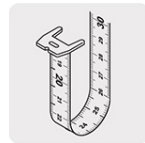
Cinta impresa por ambos lados