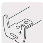
Gancho doble (excepto FH-3M)