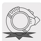
Resistente a impactos