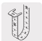
Cinta impresa por ambos lados