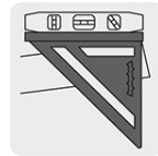
Uso con nivel