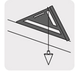
Uso con plomada