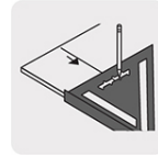
Muecas para facilitar trazado