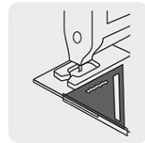
Uso como guía de corte