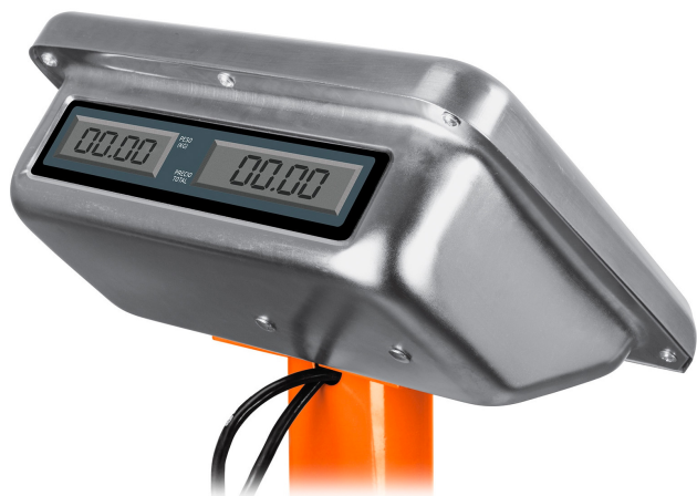
Doble display (usuario / cliente)