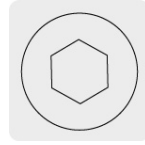
Entrada para llave allen