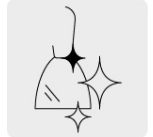
Pulido espejo para fácil limpieza