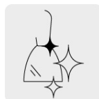
Pulido espejo para fácil limpieza