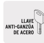
LLAVE ANTI-GANZÚA DE ACERO