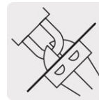
Gancho de alta resistencia al corte